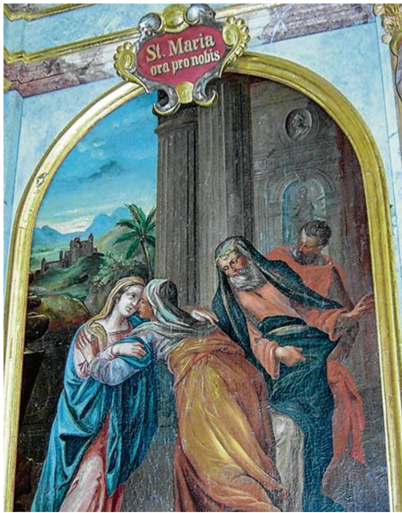
Das Altarblatt aus dem 19. Jahrhundert zeigt den Besuch Marias bei ihrer Base Elisabeth.

In der Kapelle hängt auch ein Gemälde mit dem heiligen Johannes